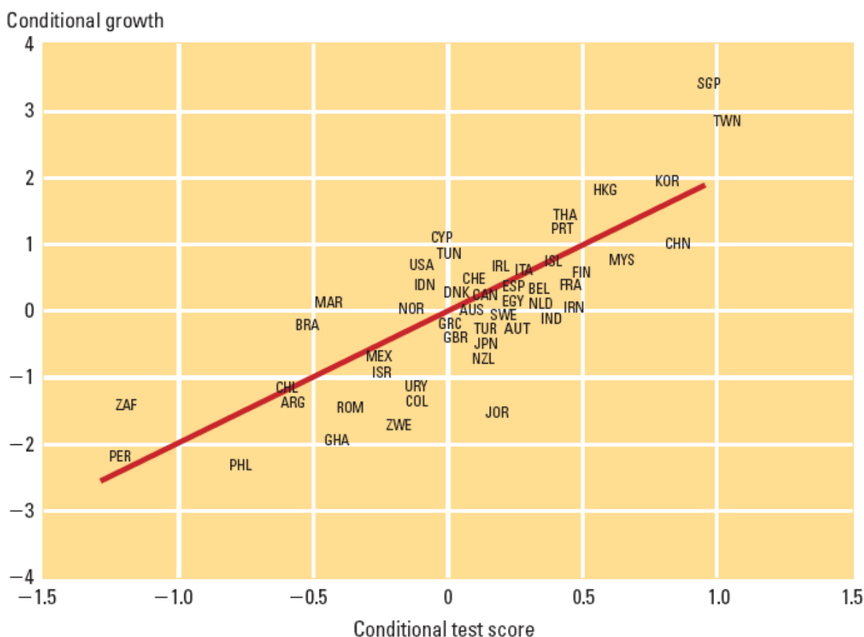
Gráfico 1: La calidad de la educación (medida por resultados de pruebas internacionales de aprendizaje) tiene un fuerte impacto sobre el crecimiento económico de los países